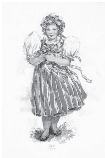
Děvče ve stylizovaném lidovém oděvu na protektorátní velikonoční pohlednici. Kresba Marie Fischerové-Kvěchové. Osobní archivu autorky.