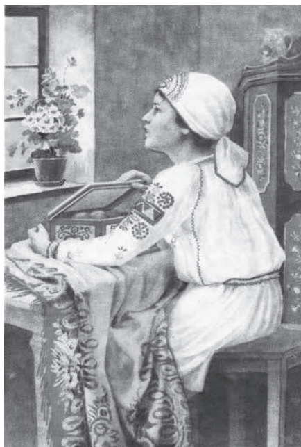
Kresba dítěte ve svérázovém oblečení od akademického malíře A. K. Pavlíka na protektorátní velikonoční pohlednici.