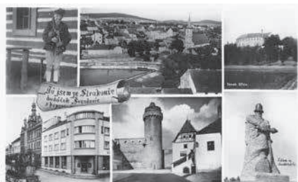
Protektorátní pohlednice Strakonice s fotografií dudáka ve strakonickém kroji.