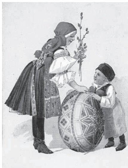
Kresba hanáckého kroje v podání akademického malíře K. Šimůnka na velikonoční protektorátní pohlednici. Osobní archiv autorky.