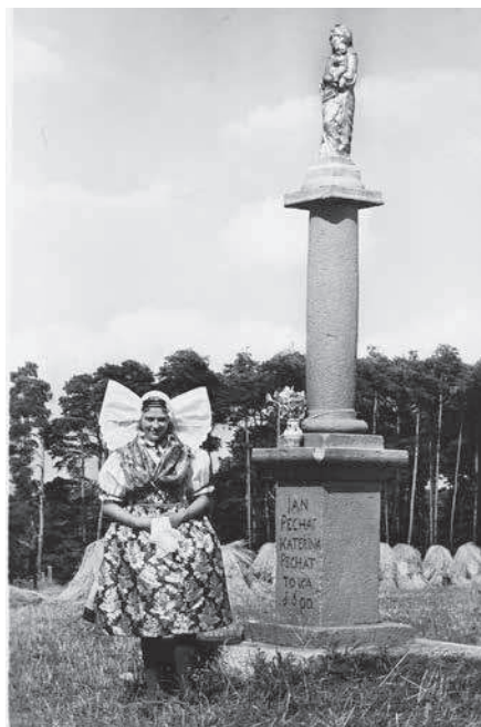
Fotografie dívky ve slavnostním plzeňském kroji na protektorátní pohlednici.