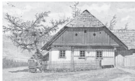
Umělecká kresba roubeného domu ze Šumavy na protektorátní pohlednici.