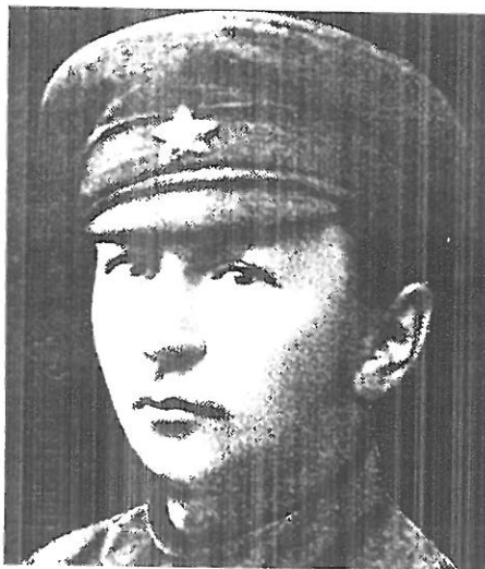
Jaroslav Hašek als Politikommissar der 5. Armee in Rußland.

In den Vordergrund zu treten hatte die Furcht vor den Deutschen, nicht die Bewunderung für ihre kulturellen Leistungen oder ein romantisches Regensburg-Bild. Und Hašeks Ängste erfahren ihre Begründung von den historischen, eben von diesem mitteleuropäischen Volk zu verantwortenden Katastrophen her. Damit aber der Kontinent nicht gänzlich in Chaos und Zerstörung versinkt, gibt es wieder eine Empfehlung für die Zukunft wie einst schon vom Geschichtsschreiber des Landshuter Erbfolgekriegs: „ Musí býti zkročení Němci! Proto jdeme společně se všemi, kteří chtějí zbavit Evropu němekého násilí, posledního zbytku barbarské hanby. (Es müssen gebändigt werden die Deutschen! Deswegen gehen wir gemeinsam mit allen, die Europa von der deutschen Gewalt befreien wollen, vom letzten Fest barbarischer Schande). “