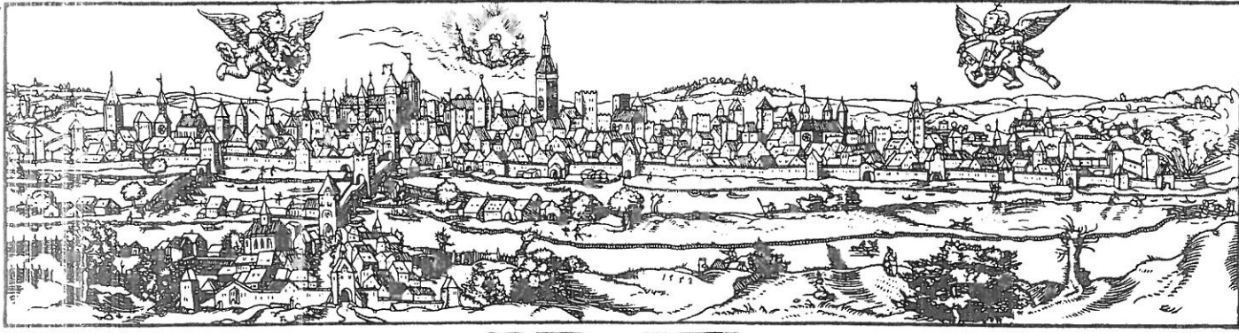
RATISBONA / Regensburg